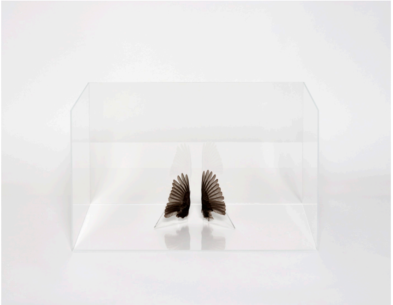
Charlotte Brüel | Invisible Sculptures | NILS STÆRK 2020.