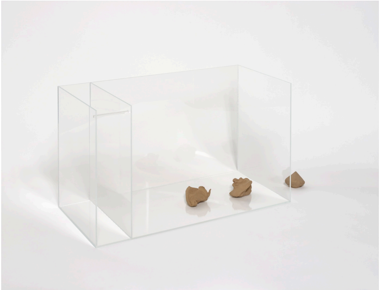
Charlotte Brüel | Invisible Sculptures | NILS STÆRK 2020.