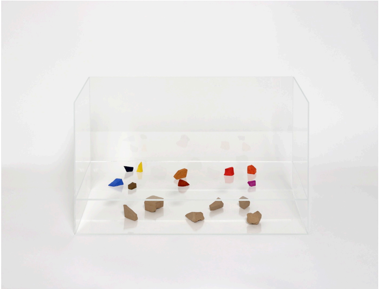
Charlotte Brüel | Invisible Sculptures | NILS STÆRK 2020.