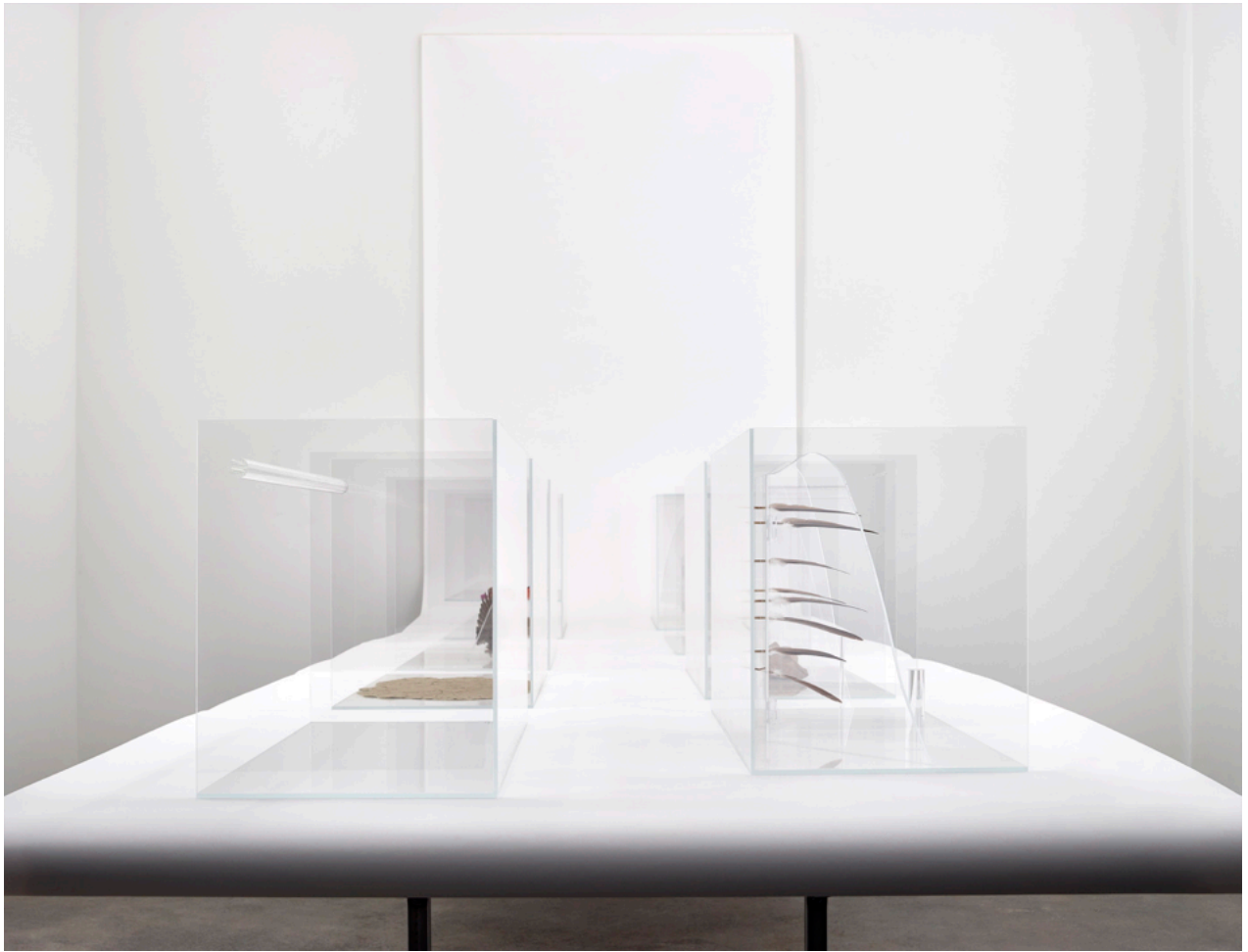
Charlotte Brüel | Invisible Sculptures | NILS STÆRK 2020. Foto: Malle Madsen.